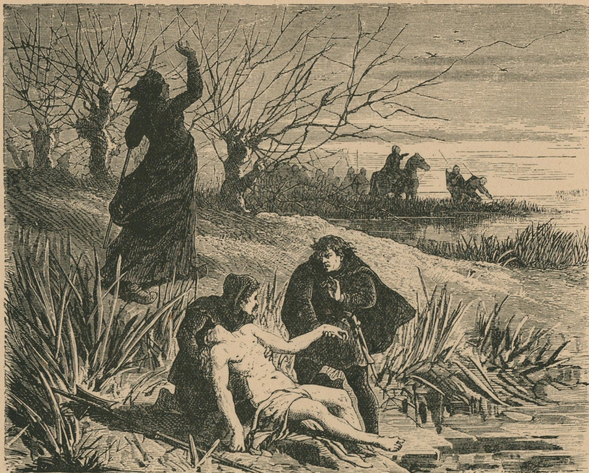
159. — Découverte du cadavre de Charles le Téméraire dans les roseaux de l'étang de Saint-Jean, sous les murs de Nancy, le 7 janvier 1477.

Ontdekking van het lijk van Karel den Stoute, in het riet van den Sint-Jansvijver, onder de muren van Nancy, den 7 den Januari 1477.